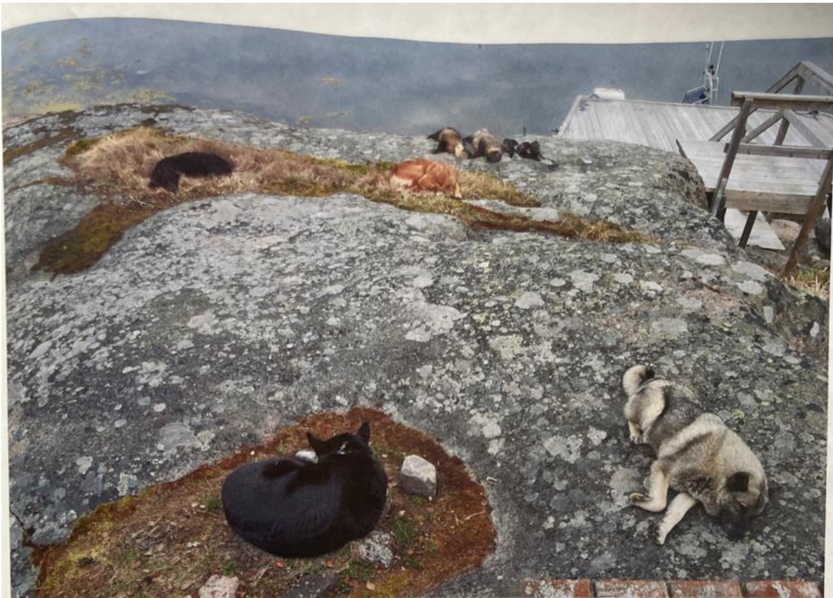
Koirat ovat saaneet toisen mahdollisuuden myötä elää täysipainoisen metsästyskoiran elämän.