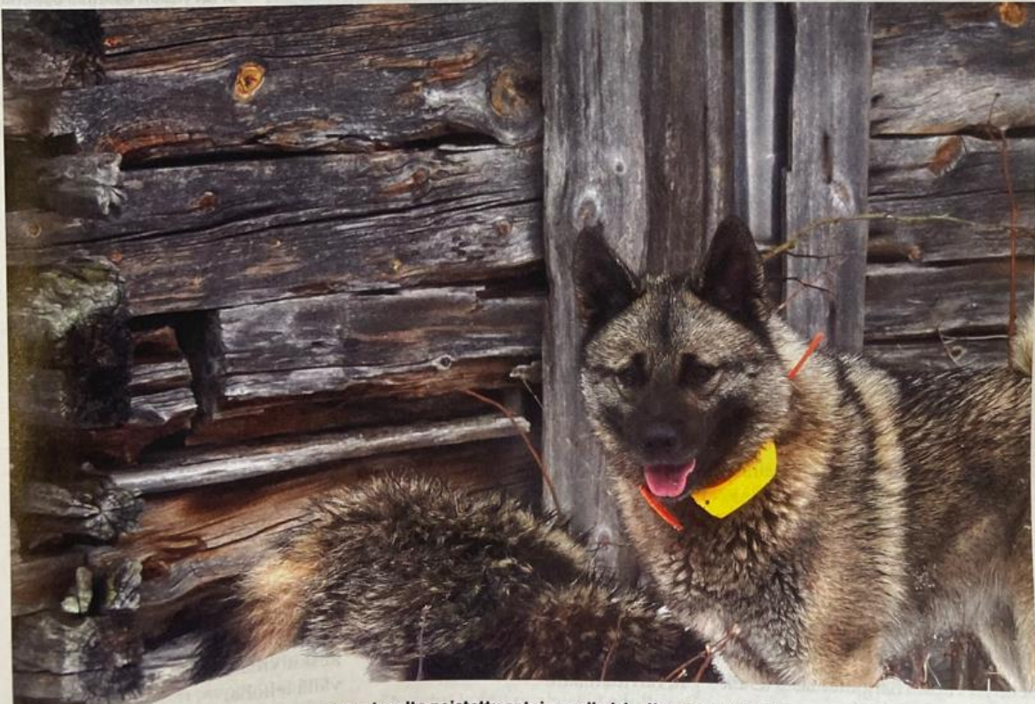
Parissa vuosikymmenessä on Bennyn hoitoalueelta poistettu satoja supikoiria. Nyt pienpetokanta on merkittävästi harventunut.

Ahvenanmaalle on kuin varkain pääsyt muodostumaan hyvin vahva su-